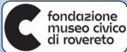
laboratori con il Museo