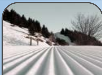
corso di sci nordico