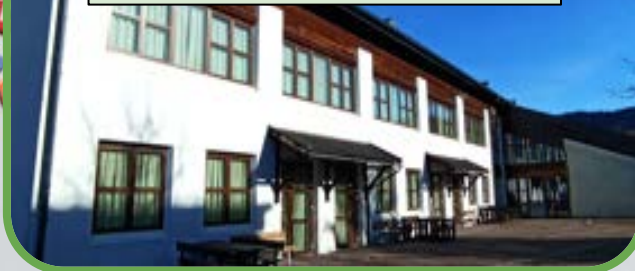
Scuola Primaria di Folgaria