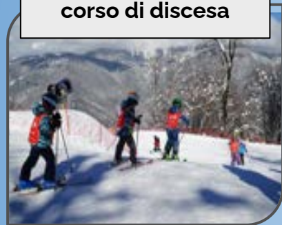
corso di discesa