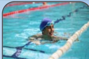
corso di nuoto