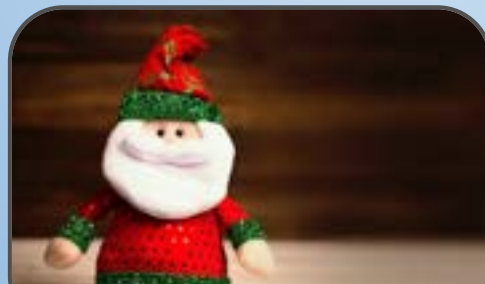
spettacolo di Natale