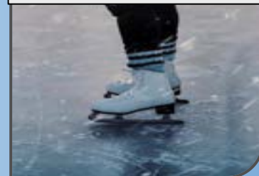
corso di pattinaggio