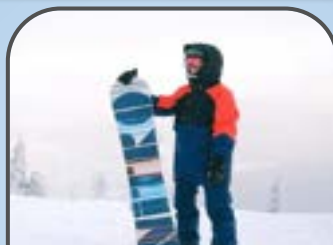
corso di snowboard